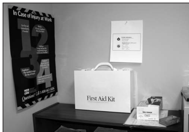
Poste de premiers soins

Si un chantier comporte peu de travailleurs, le poste de premiers soins peut simplement être une trousse située